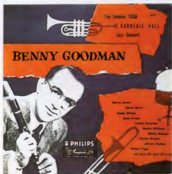
Algunas de las ediciones europeas y americanas del Concierto del Carnegie Hall.

carrera con el archiconocido "I Got Rhythm", cuyo veloz y percusivo arreglo final consigue poner una vez más en pie al público. Aquí es donde queda claro que, más que en el seno de la gran orquesta con la que ejecutaba solos forzosamente adaptados a los arreglos y revestidos de cierta espectacularidad, fue en el contexto de estos grupos pequeños donde Goodman, más libre y rodeado de músicos de primer orden con los que conseguía un alto grado de comunicación y de creatividad, pudo dar la exacta medida de su gran capacidad de improvisador.